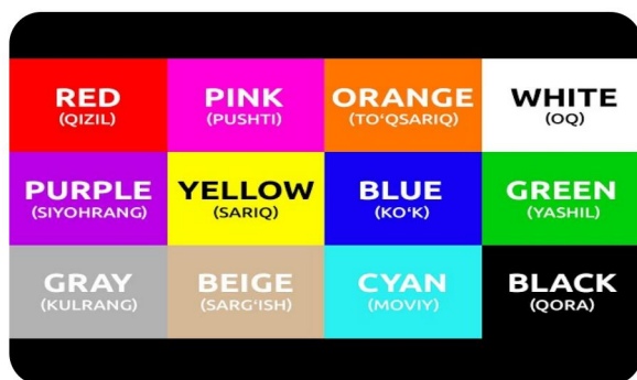
Ranglar orqali so'z yodlash 1- rasm.